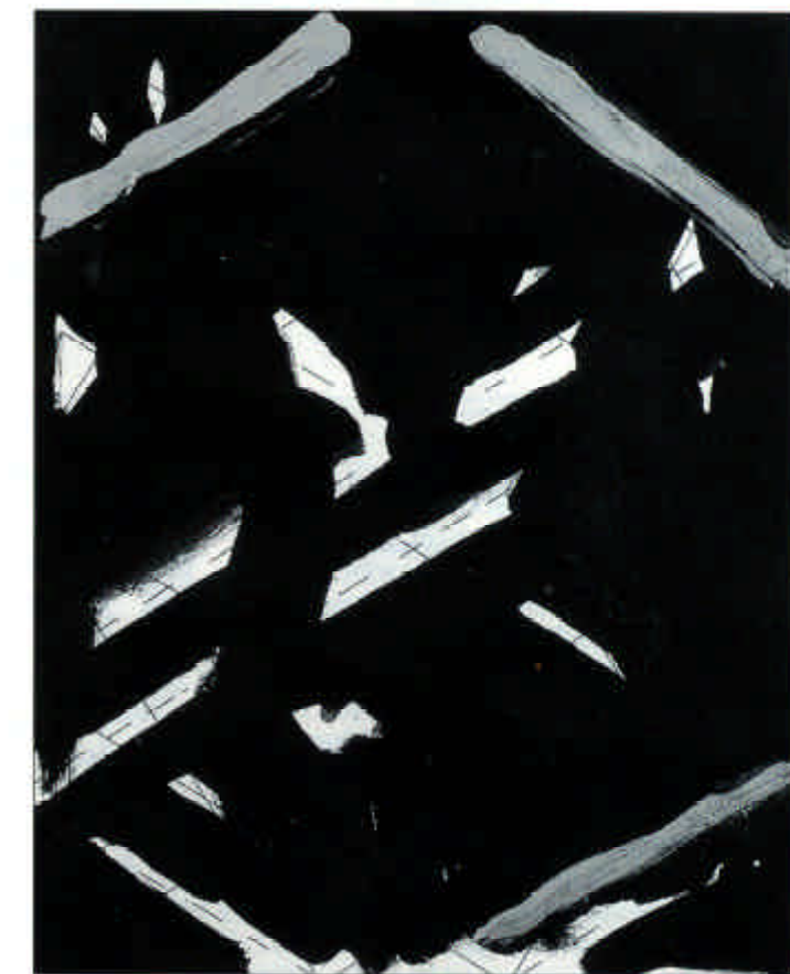
Magnus Carlén, målning, 12,5x15,5 cm, 1991.

Medan jag arbetar fattar jag inga rationella beslut; när jag skissar arbetar jag dock ofta mot eller med klassisk estetik. Jag är t.ex. fascinerad av Piero della Francescas måleri, och hans användning av geometri. Sedan arbetar jag bort dessa spår i