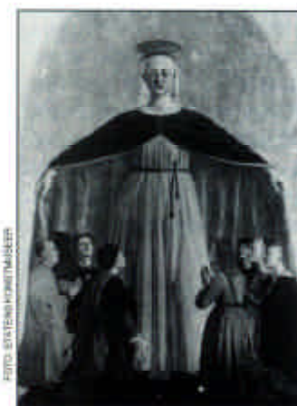
Inspiratören Piero della Francesca